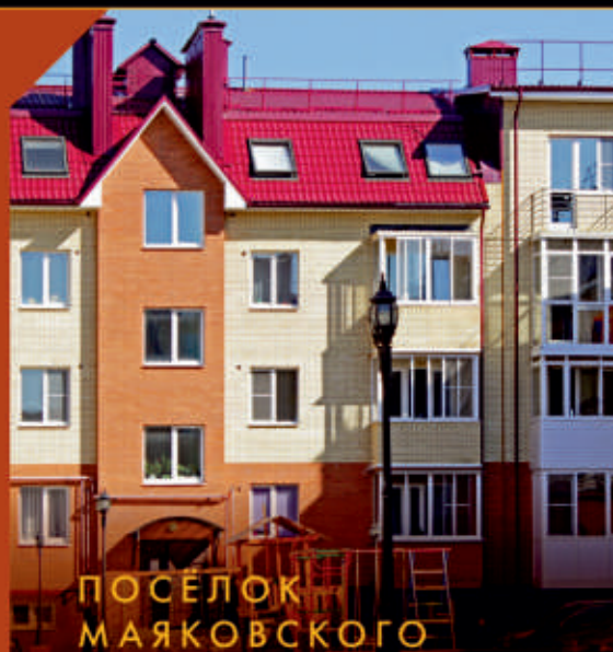
ПОСЕЛОК МАЯКОВСКОГО Ярославль

Многоквартирный жилой дом из керамического кирпича.