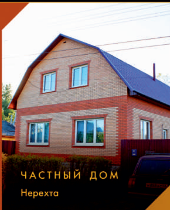
ЧАСТНЫЙ ДОМ Нерехта

Нашими партнёрами также являются: Группа компаний «ПИК», «Urban Group» (г. Химки), строительно-инвестиционная компания «Промсервис» (г. Москва), строительно-инвестиционный холдинг «Аквилон-Инвест» (г. Архангельск), общество «Базис ЛТД» (г. Вологда).