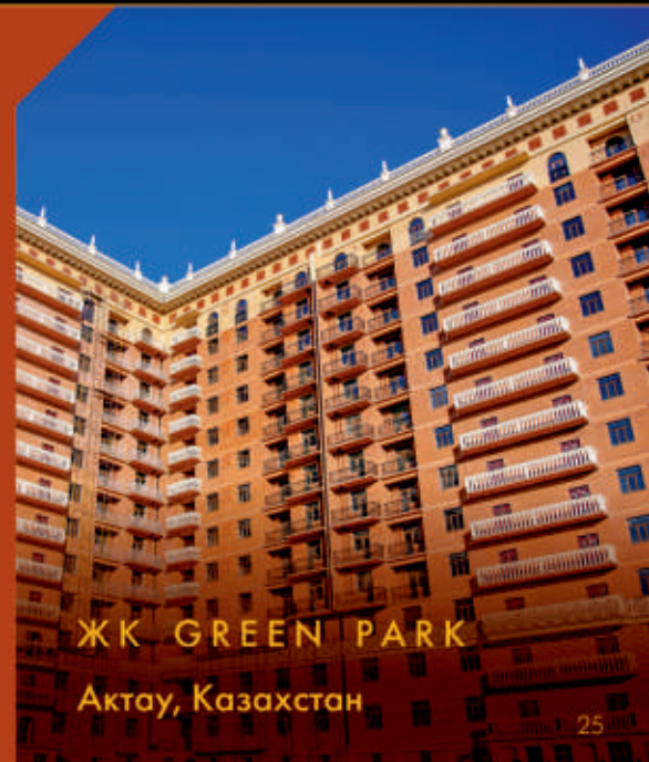
ЖК GREEN PARK

Застройщик: ТОО «Модерн Констракшн Груп Казахстан».