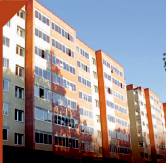
ЖК «ЧКАЛОВСКИЙ» Ярославль

Малоквартирный четырёхэтажный жилой дом премиум-класса построен из керамического кирпича Клим Клинкер® .