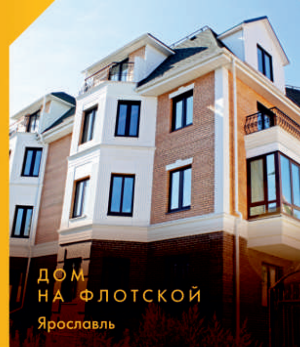
ДОМ НА ФЛОТСКОЙ Ярославль