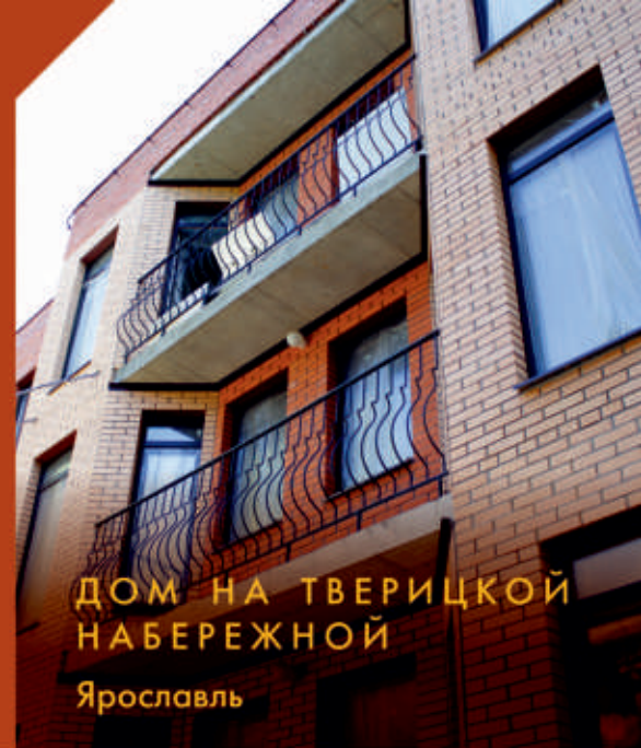
ДОМ НА ТВЕРИЦКОЙ НАБЕРЕЖНОЙ