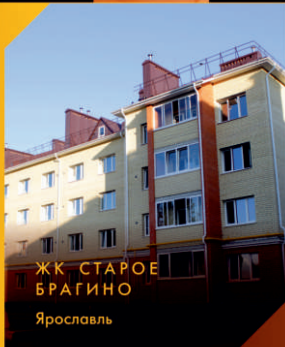
ЖК СТАРОЕ БРАГИНО