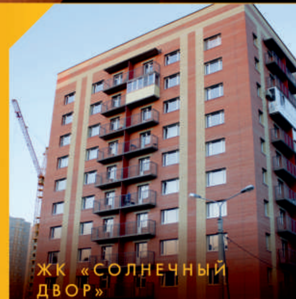
ЖК «СОЛНЕЧНЫЙ ДВОР» Ярославль