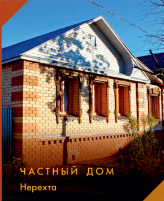
ЧАСТНЫЙ ДОМ Нерехта