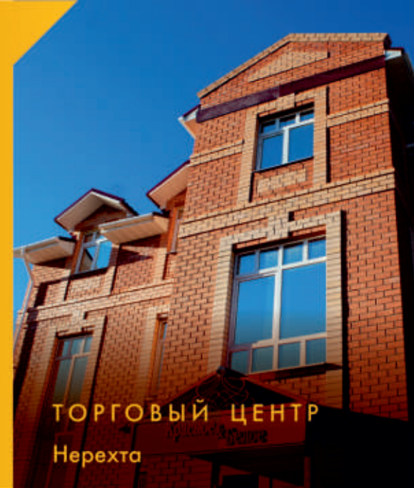
ТОРГОВЫЙ ЦЕНТР Нерехта